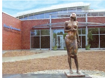
Városi Sportuszoda bejárata

A Kossuth téren lehet sétál- Fekete Sas Kávézót és a Ging- megnézni, ami az egykori vá-