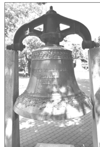
a Városháza egykori harangja

A Kossuth téren lehet sétálgatni és látni a Városházát , a Fekete Sas szállót , vagy azt a harangot megnézni, ami az egykori városházában volt. Annak idején nagy tűzvész volt a városháza tornyában és csak a harangot tudták „kimenteni”, ami a mai napig ott van a Kossuth téren