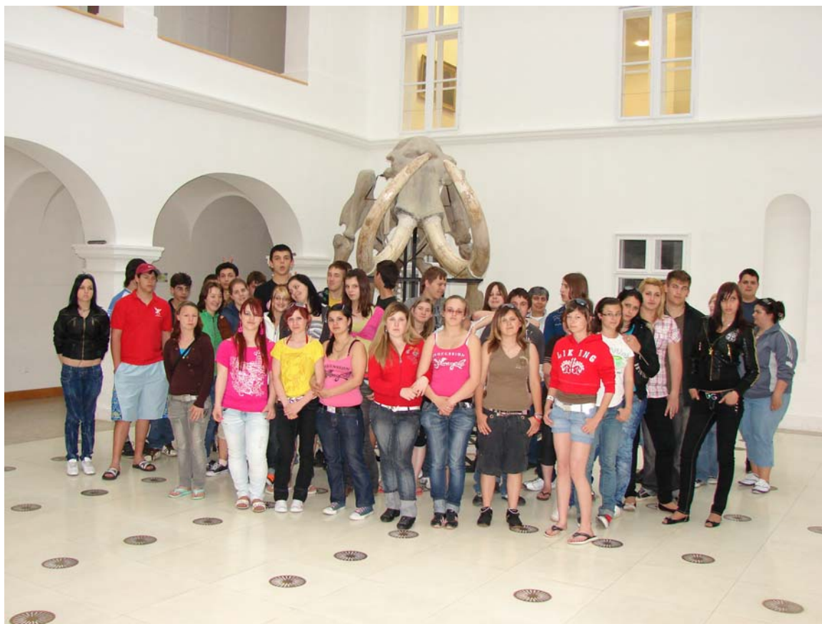
A Mátra múzeum előtere