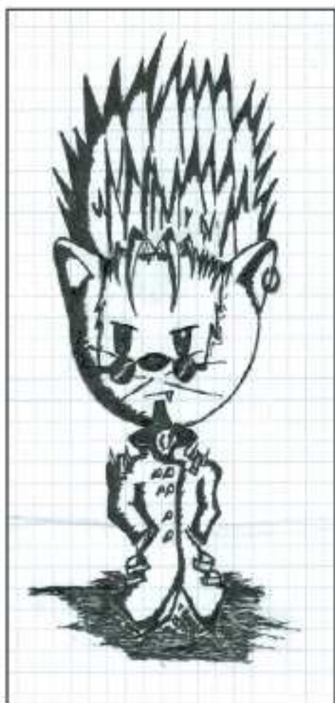
Veréb Józsi rajza