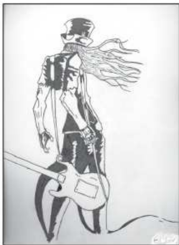
Veréb Józsi rajza