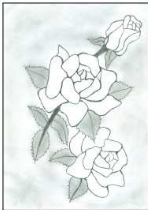
Forró Tündi rajza